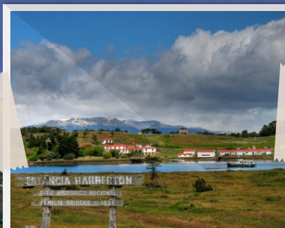
1 Estancia Harborton (Ushuaia)