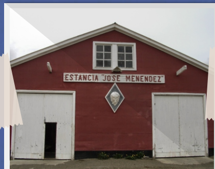
3 Estancia 1ra Argentina José Menendez (Río Grande)