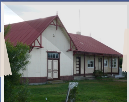
5 Estancia Sara (Río Grande)