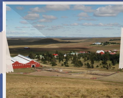
4 Estancia 2da Argentina Maria Behety (Río Grande)